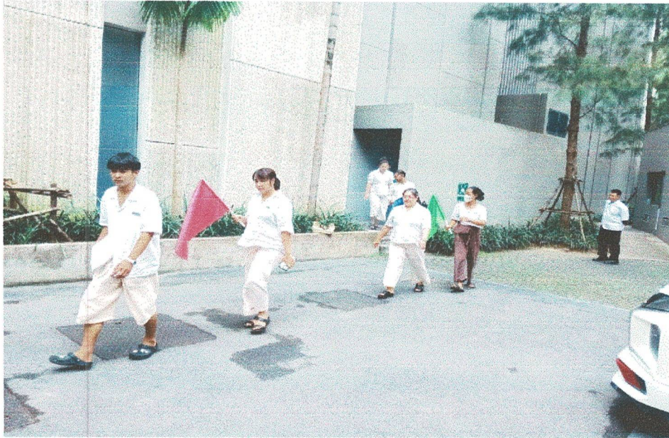
พนักงานอพยพไปยังจุดรวมพล