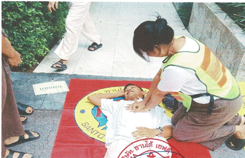
ทีมปฐมพยาบาลทำการปฐมพยาบาลเบื้องต้นก่อนนำส่งโรงพยาบาล