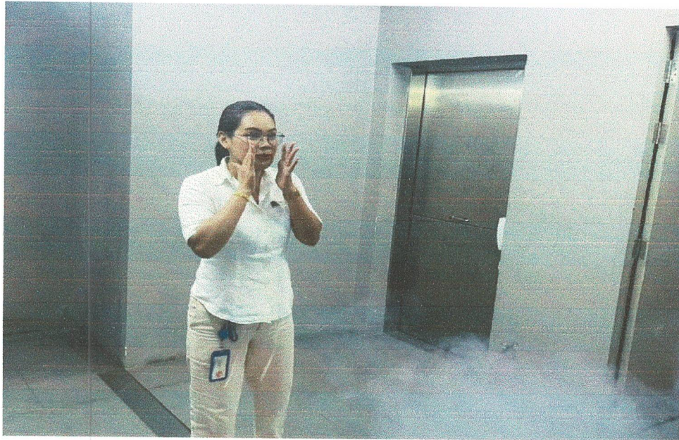
การจำลองสถานการณ์เกิดเหตุเพลิงไหม้