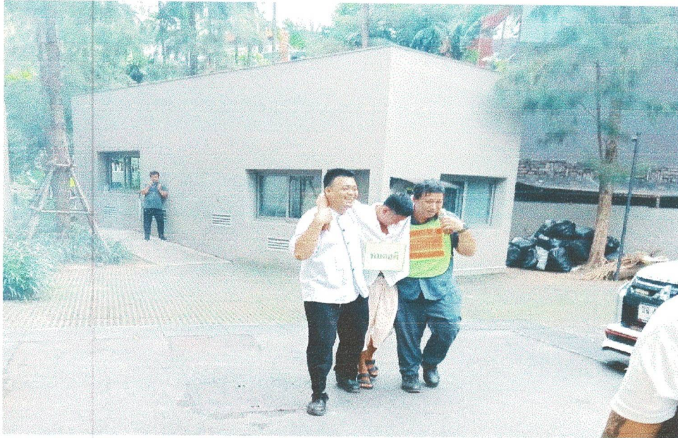
ทีมค้นหา/ช่วยชีวิตนำพนักงานที่สูญหายและได้รับบาดเจ็บไปยังจุดปฐมพยาบาล