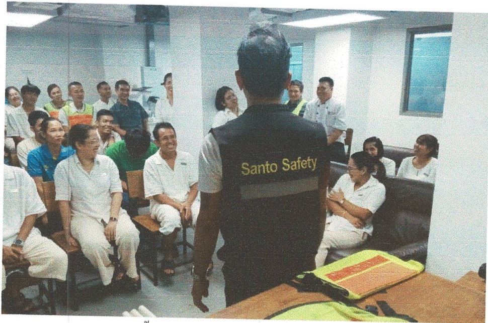
ประชุมชี้แจงแผนการดับเพลิงและแผนอพยพหนีไฟ