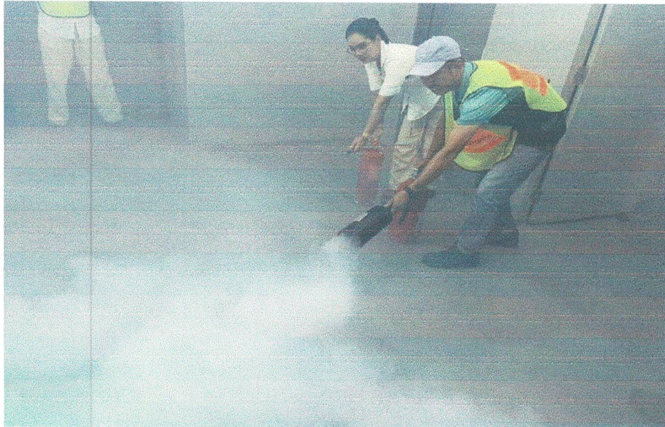
ทีมดับเพลิงใช้ถังดับเพลิงดับไฟขั้นต้น