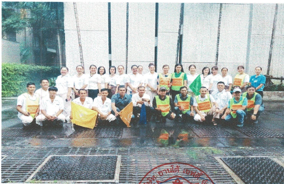
ผู้เข้าร่วมฝึกซ้อมดับเพลิงและฝึกซ้อมอพยพหนีไฟ