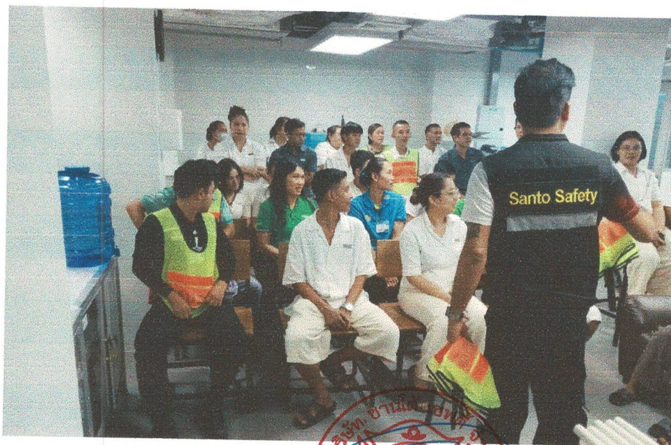
ซักซ้อมแผนการดับเพลิงและแผนอพยพหนีไฟ