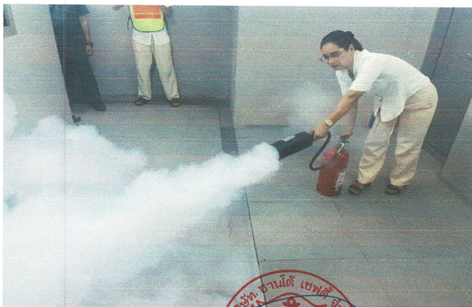
พนักงานที่พบเห็นใช้ถังดับเพลิงทันที