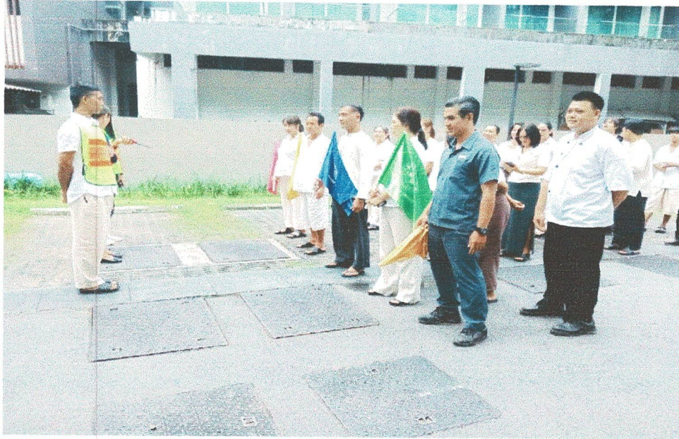
ผู้อำนวยการดับเพลิงได้รายงานว่าสามารถดับเพลิงได้แล้ว จึงสั่งยกเลิกแผนอพยพหนีไฟ